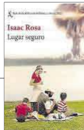
Lugar seguro Isaac Rosa Editorial: Seix Barral 312 páginas, 18,90 euros

florero. Suerte que años después de su puño y letra nació Ree Dolly que es una de esas brillantes protagonistas que dejan huella.