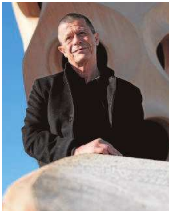
Emmanuel Carrère, autor de «Yoga»