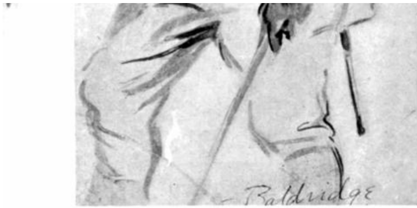
Dibujo de Cryus Leroy Baldrige de los tiradores senegaleses durante la I Guerra Mundial.

salvajismo pero también permite reflexionar sobre el salvaje.