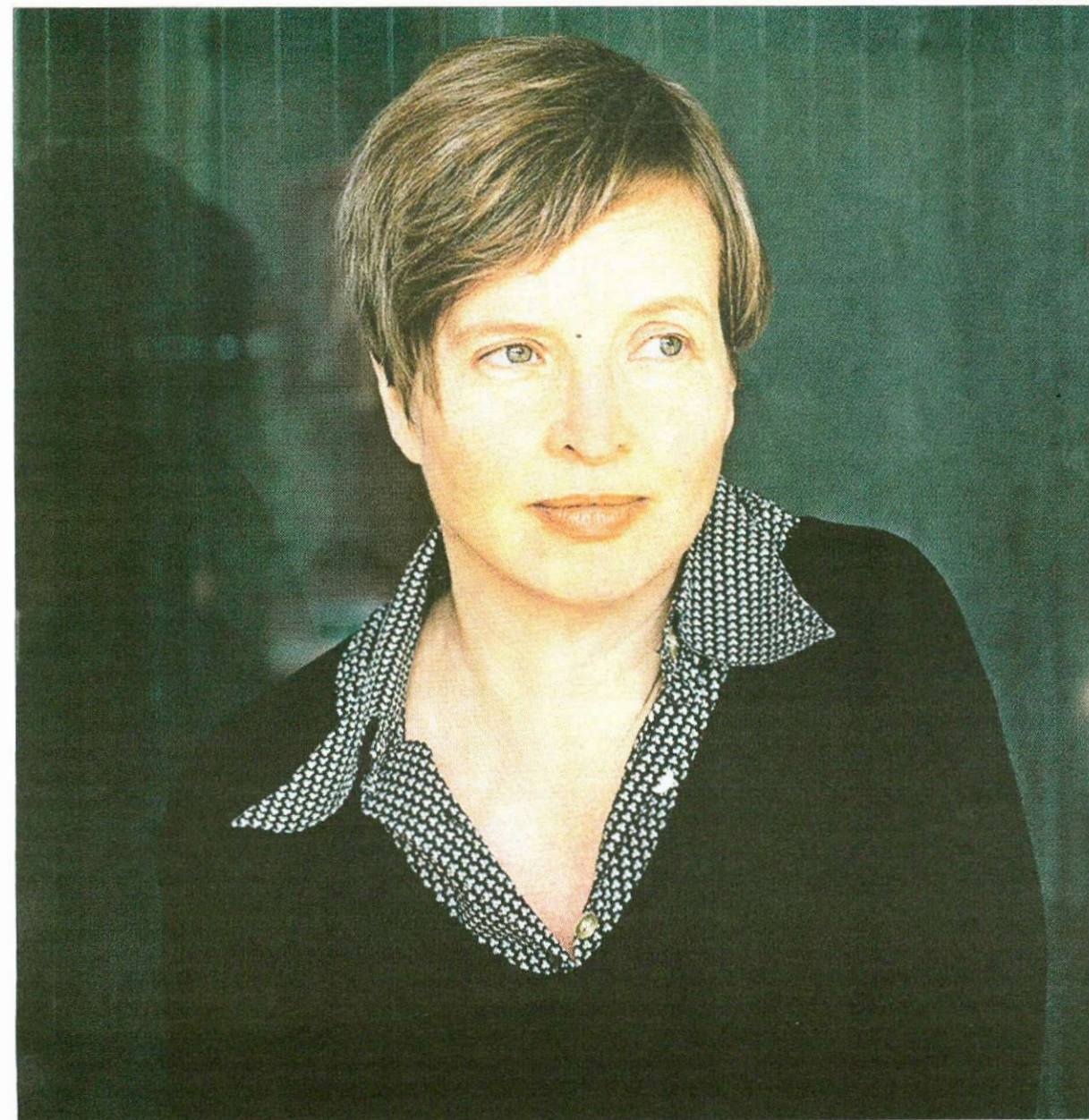
JENNY ERPENBECK. Nació en Berlín Oriental en 1967. La crisis de los refugiados plasmada en una novela.

En el lago frente a la casa de Richard se ahogó un hombre que no emerge a la superficie: nadie navega en el lago ya, nadie se atreve con esa sepultura. Entretanto, el catedrático jubilado resuelve ya no escribir otro libro sobre Tácito o Séneca, sino interesarse por las vidas de los africanos a los que asiste, protege, presta su piano, su comida y su casa. A Ithemba, Rashid,