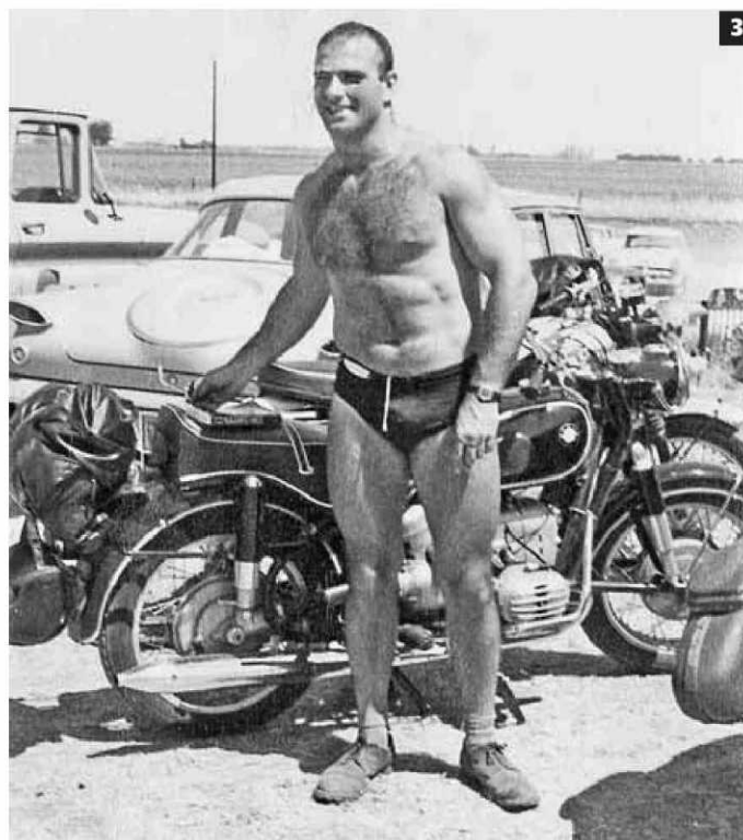
► «EL TIEMPO ES LA SUSTANCIA DE LA QUE ESTOY HECHO», la cita de Borges que abre el libro póstumo de Oliver Sacks. 1 En un viaje al Perú, al Machu Pichu. 2 Con Robin Williams durante el rodaje de «Despertares». 3 En California en los años sesenta.

nes más inexplicables del comportamiento humano, Sacks, en el final de su vida, reflexiona sobre temas como la memoria, la creatividad, las experiencias cercanas a la muerte, Freud, como pionero de la neurología o un texto tardío de Darwin sobre las flores. Sacks recuerda una conversación siendo pequeño con su madre a propósito de la polinización de un magnolio. En otro de los textos, «La