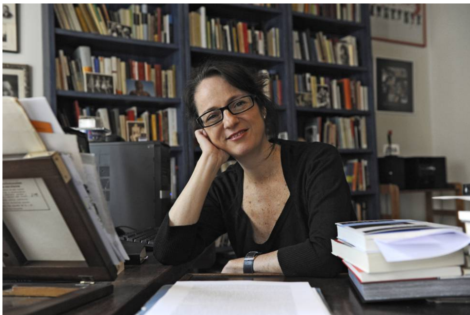
La escritora española Marta Sanz en la quinta edición del festival literario "Centro América Cuenta" en Managua.