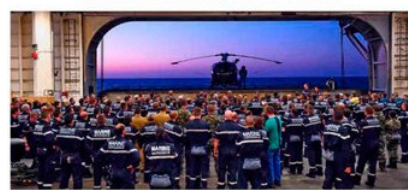
PREPARADOS PARA EL COMBATE. Los militares franceses avanzan a sus respectivos puestos de combate en el marco de un ejercicio de entrenamiento. Desde que los franceses de París se empezaron a rebelar el 2011...